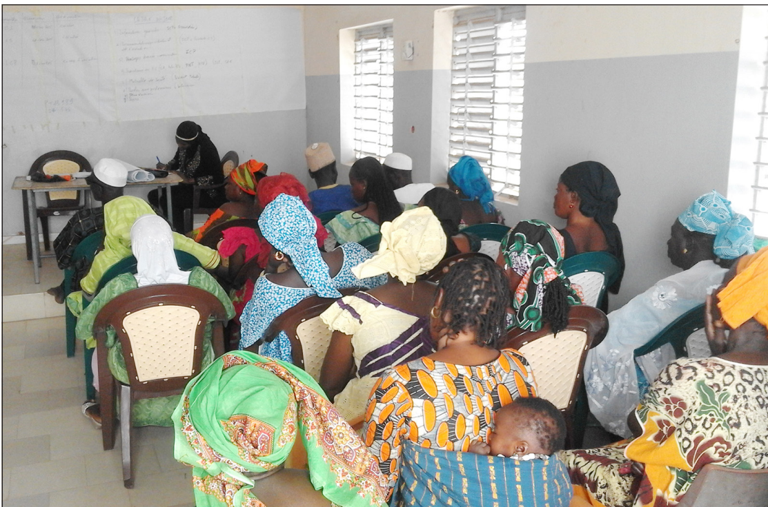
Photo 5 : Partage des principaux résultats du poste de santé de Keur Madiabel (DS Nioro) lors de la réunion de coordination mensuelle