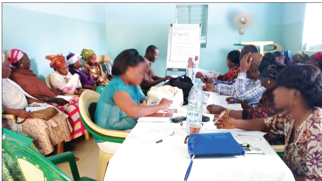
Photo 1 : réunion de coordination mensuelle du poste de santé de Fimela (DS Diofior)