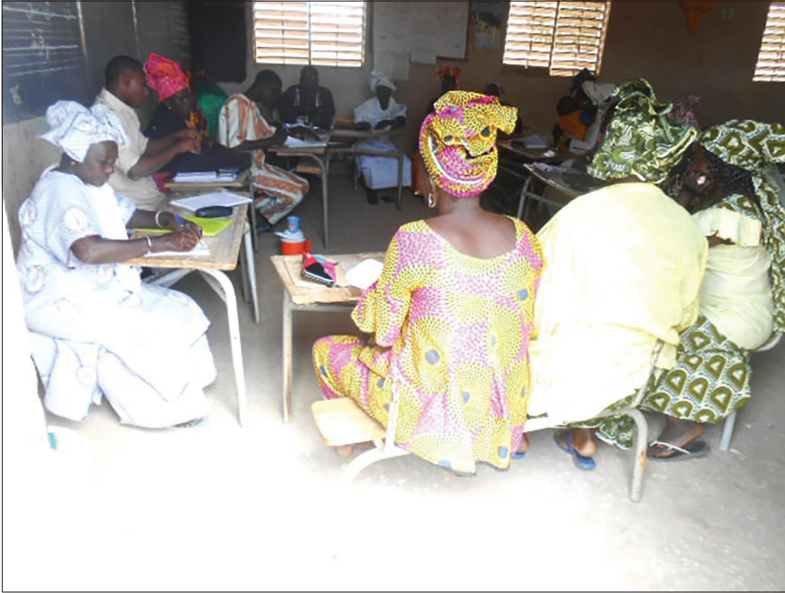
Photo 4 : réunion de coordination mensuelle du poste de santé de Soudiane Dimlé (DS Diofor)